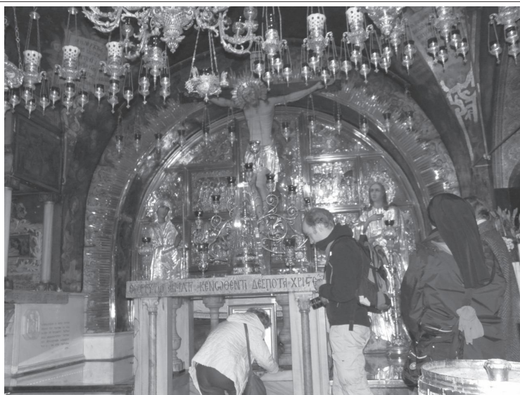
Modlitwa na Górze Kalwarii jest szczególnie ważna dla chrześcijan