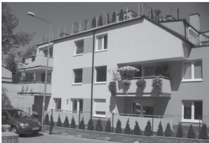
Oddana w ubiegłym roku Willa Gardenia kipi życiem i kwieciami.