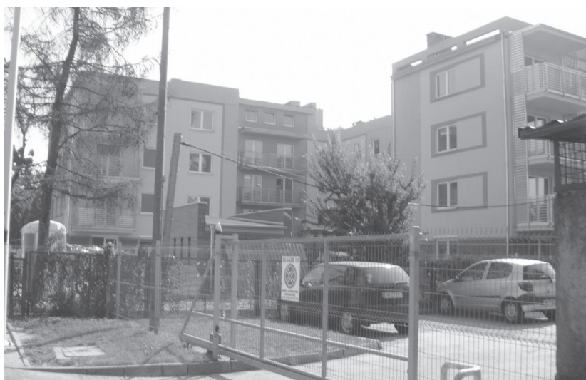
Lokale przy Zabrodzkiej są już gotowe do zamieszkania