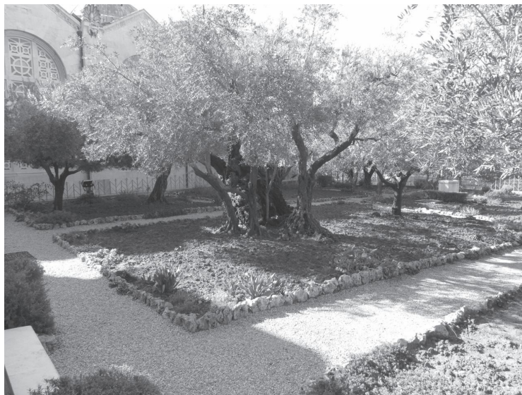
Oliwne drzewa w Ogrójcu liczą sobie ponad 2 tysiące lat