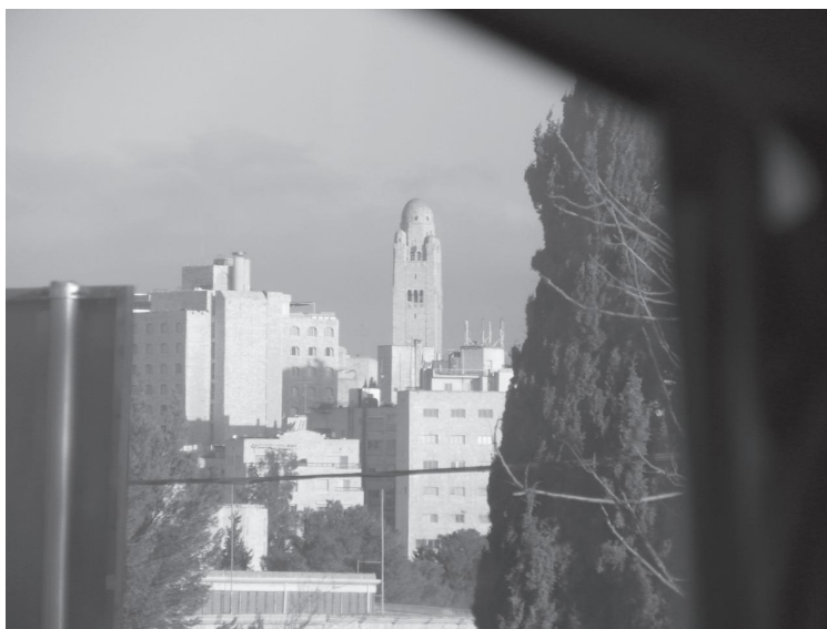
Ale jest też nowe oblicze Jerozolimy