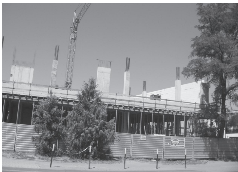
Wyrastające z ziemi Wałbrzyska Center już niedługo posłuży ludziom