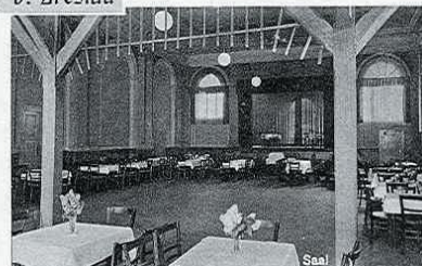
Klettendorf b. Breslau

W pierwszej dekadzie XX wieku kompleks budynków trzykrotnie zmienił właścicieli i tym samym nazwy na „ Gasthaus u. Ausspannung von Henrich Hansel ”, kolejno „ Wilhelm Jung's Saal und garden etablissement ” - reklamował się jako lokal rodzinny z tańcami w każdą niedzielę, ostatnia zmiana nastąpiła przypuszczalnie w latach 30-tych, wówczas lokal nazwano „ Conrad Gaststätte Kipke Ausschank ”.